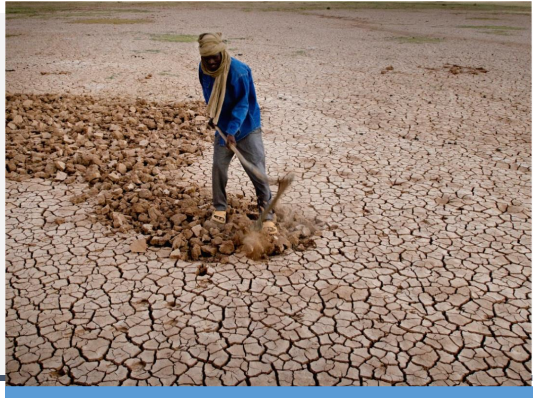
FOR LITE VANN